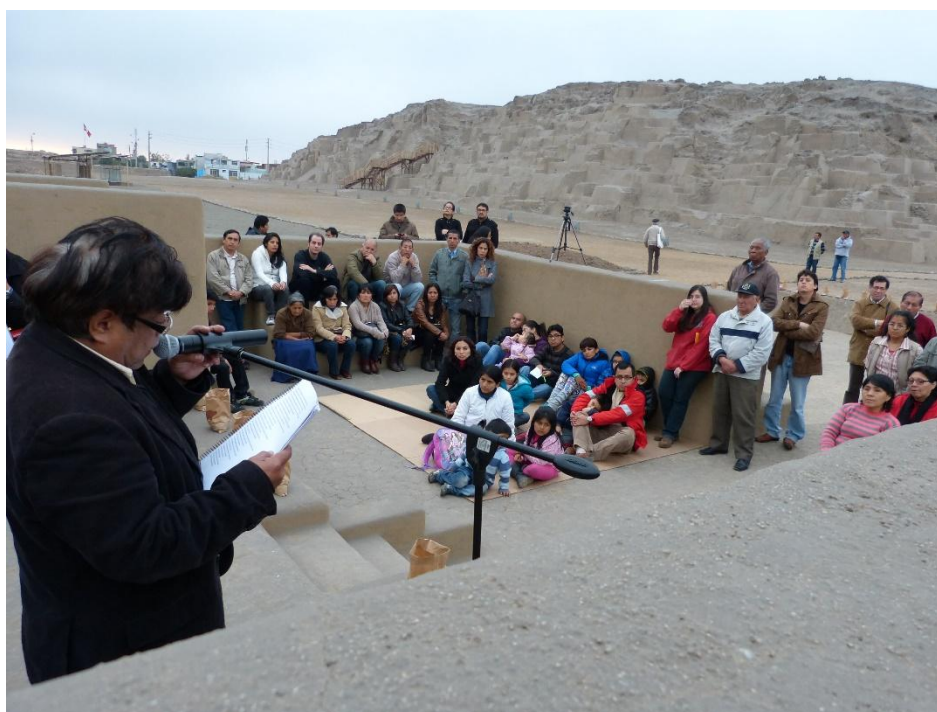
Primera edición de “La Huaca es Poesía”