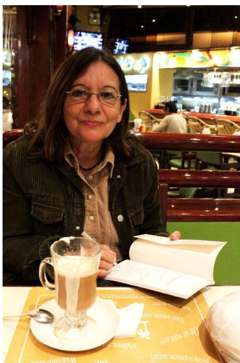
Carmen Ollé

Carmen Ollé (1947) es además narradora, crítica literaria y docente universitaria. Su poesía descarnada, directa y recónditamente irónica la hace una de las voces más destacadas de la lírica de nuestro país. Ha escrito el famoso y rupturista poemario Noches de Adrenalina . En prosa se le deben Las dos caras del deseo , Una muchacha bajo su paraguas y más recientemente Retrato de una mujer sin familia ante una copa . Ha sido directora del Pen Club del Perú y presidenta de la Red de Escritoras Latinoamericanas. El 2015 recibió el Premio Casa de la Literatura Peruana.