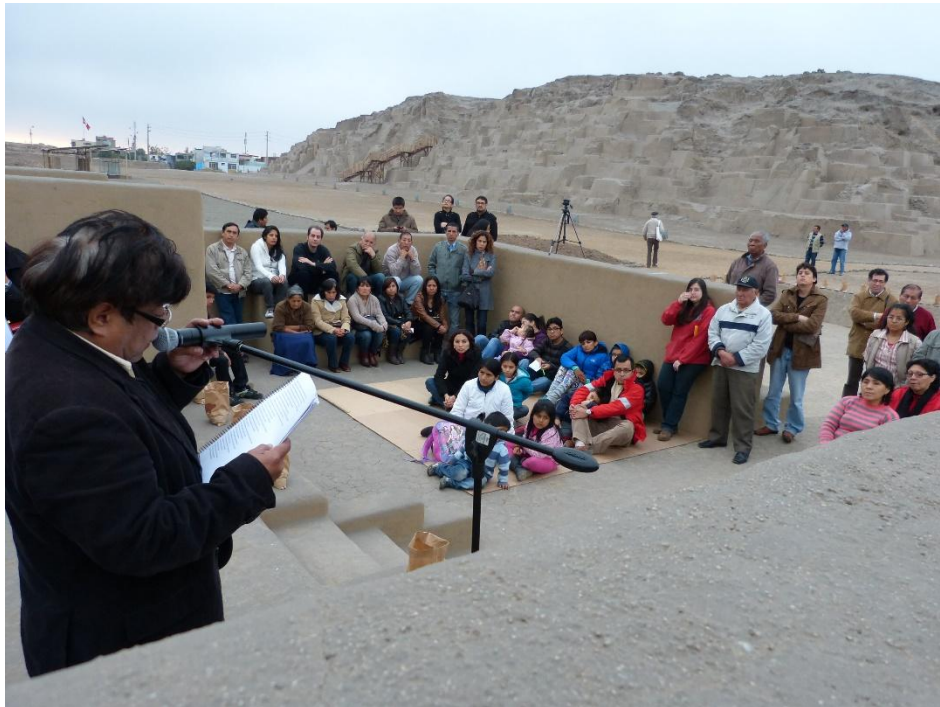
Primera edición de “La Huaca es Poesía”