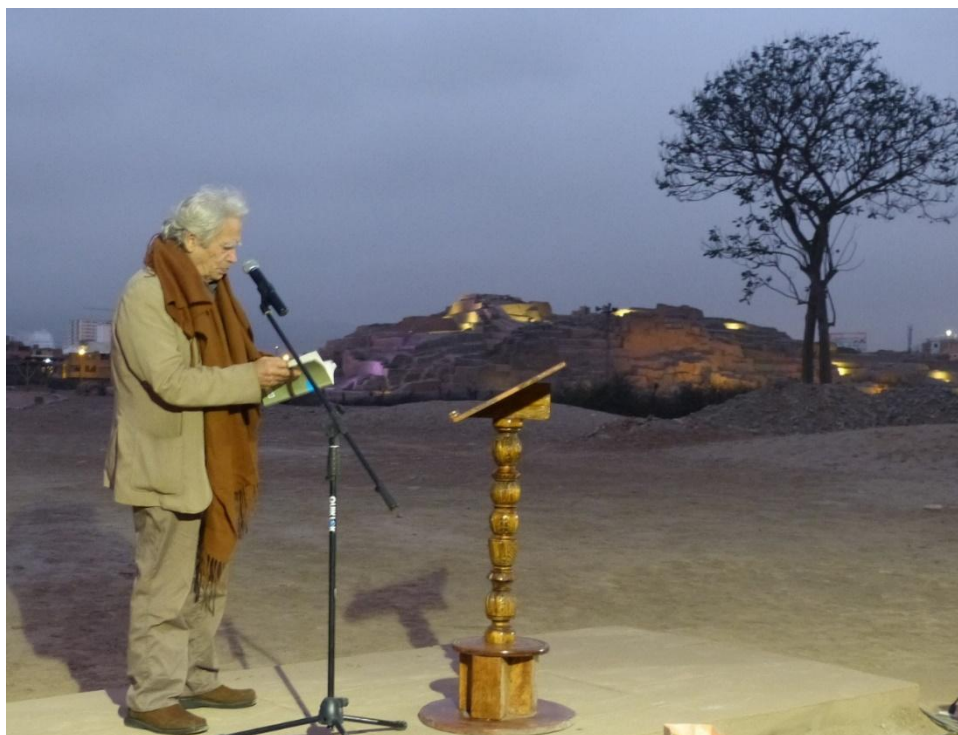
Rodolfo Hinostroza en su homenaje de "La Huaca es Poesía" 2015

Carmen Ollé (1947) es además narradora, crítica literaria y docente universitaria. Su poesía descarnada, directa y recónditamente irónica la hace una de las voces más destacadas de la lírica de nuestro país. Ha escrito el famoso y rupturista poemario Noches de Adrenalina . En prosa se le deben Las dos caras del deseo , Una muchacha bajo su paraguas y más recientemente Retrato de una mujer sin familia ante una copa . Ha sido directora del Pen Club del Perú y presidenta de la Red de Escritoras Latinoamericanas. El 2015 recibió el Premio Casa de la Literatura Peruana.