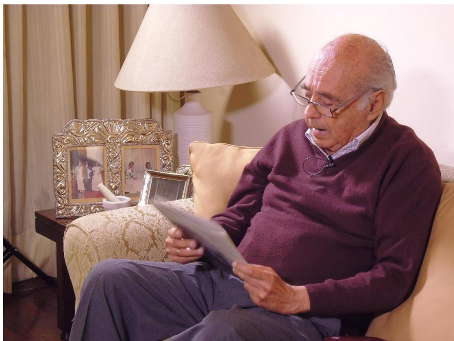
Carlos Germán Belli lee sus poemas durante la entrevista que dió al equipo del proyecto Mateo Salado

Carlos Germán Belli (1927) es el poeta vivo más importante del país y uno de los más destacados de la poesía contemporánea. Su estilo combina formas clásicas y culteranas con un lenguaje contemporáneo, que no evade ni aún la jerga. Entre sus varias obras se encuentran ¡Oh Hada Cibernética! , El pie sobre el cuello , Sextinas y otros poemas , En alabanza del bolo alimenticio , ¡Salve, Spes! , etcétera. Ha sido Premio Nacional de Poesía (1962), Premio Iberoamericano de Poesía Pablo Neruda (2006) y Premio Casa de las Américas de Poesía “José Lezama Lima” (2009). Fue distinguido por la Casa de la Literatura Peruana (2011), y se le ha cedido la Medalla al Mérito Ciudadano de la Presidencia del Consejo de Ministros (2016) y el Premio Nacional de Cultura 2016 en la categoría trayectoria. Ha sido candidato al Premio Nobel de Literatura y al Premio Príncipe de Asturias el 2007 y al Premio Cervantes el 2015.