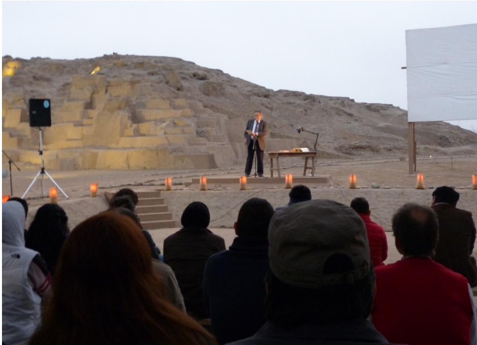
“La Huaca es Poesía” 2014