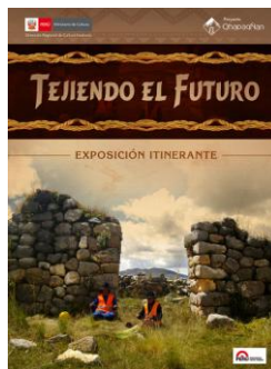
Exposiciones itinerantes “Al Encuentro de Huánuco Pampa” y “Tejiendo el Futuro” ambas en Huánuco