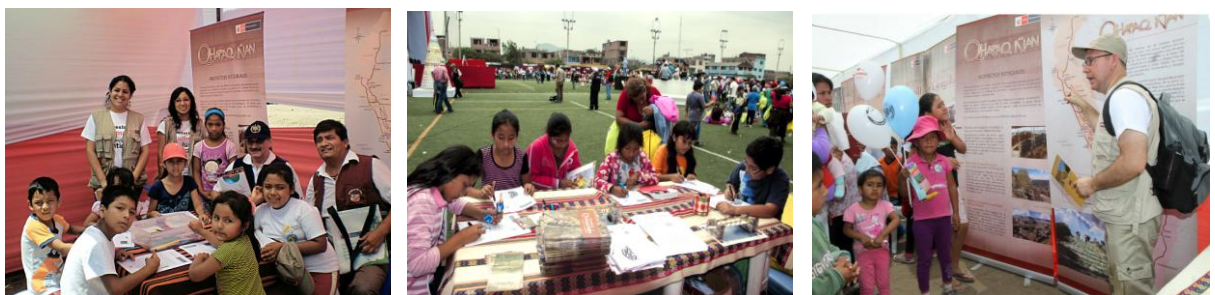
Actividades educativas en acciones cívicas

El Proyecto Qhapaq Ñan está comprometido con la educación para crear vínculos con nuestro patrimonio cultural, para que los estudiantes y la ciudadanía en general reconozcan que el patrimonio no es solo una herencia, sino que forma parte de nuestro presente y solo formará parte de nuestro futuro en la medida que podamos conocerlo, comprenderlo, respetarlo, valorarlo, cuidarlo, disfrutarlo y transmitirlo a futuras generaciones 3 .