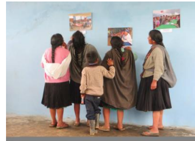
Proyección de documentales y exposición de fotografías en comunidades alejadas vinculadas al Qhapaq Ñan