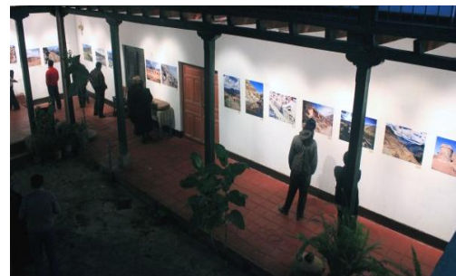
Exposición fotográfica sobre QHAPAQ ÑAN en Museo Nacional Chavín en Ancash y en Museo de Sitio Cabeza de Vaca en Tumbes