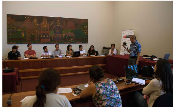
Taller de protocolo y lineamientos de la publicación científica del Proyecto Qhapaq Ñan

Quizás la actividad más completa que hemos realizado en el primer semestre del 2013 haya sido la Semana Qhapaq Ñan, que tuvo lugar en el mes de junio en el Ministerio