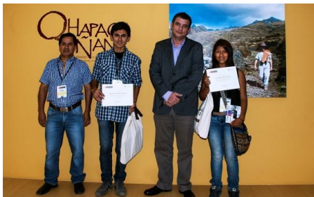
Primera edición del concurso escolar de expresión artística

En lo que va del año 2013 se han atendido a cerca de un millar de escolares que han participado en los diversos talleres y actividades educativas, se ha realizado el primer taller de verano para niños con dicha temática y se han realizado concursos escolares en las zonas de influencia de los Proyecto Integrales que el Proyecto Qhapaq Ñan viene ejecutando en los departamentos de Huánuco, Lima, Piura y Tumbes.