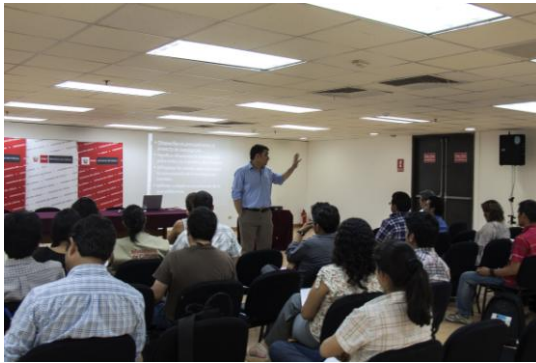
Taller de fotografía

Como parte de la preparación permanente del personal que labora en las diferentes áreas técnicas del Proyecto, se han desarrollado talleres internos de capacitación para facilitar herramientas que contribuyan el desarrollo del trabajo.