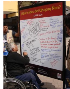
Intervenciones culturales en la estación del servicio público de transporte Metropolitano y en centros comerciales y plazas de alto tránsito peatonal en Lima norte, sur, este, oeste y centro.