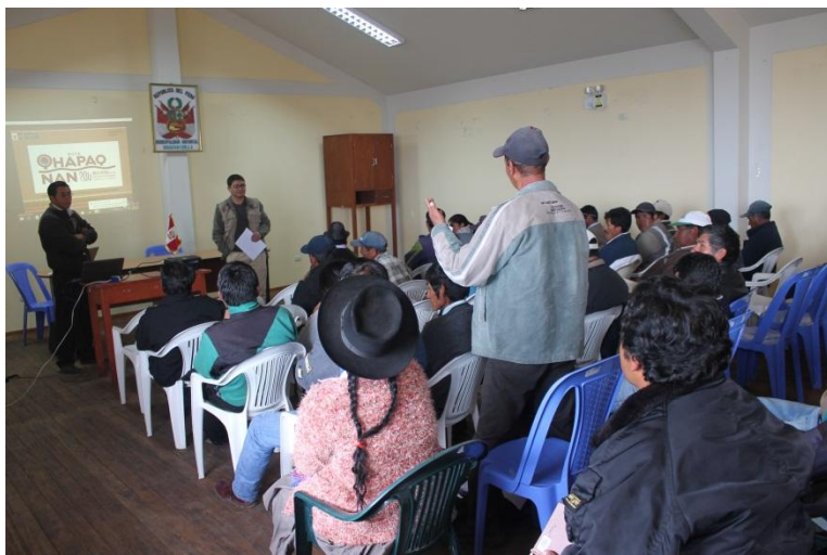
Foto 2. Población de Huamanguilla en diálogo con el equipo técnico del Qhapaq Nan y docente de la Universidad Nacional San Cristóbal de Huamanga sobre el proceso histórico de su localidad.

El proceso de la rebelión de 1814, que algunos historiadores denominan como la Insurrección del Cusco (Husson, 1992), involucró una serie de comunidades. Muchas de ellas, en la actualidad, carecen de información respecto a la participación de sus antepasados en el proceso de emancipación; tal es el caso del distrito de Huamanguilla, cuya participación presenta escasa información sistematizada y lo que se escribió no ha sido difundida entre la población de esta localidad.