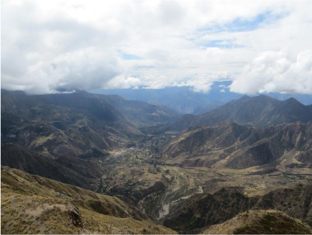
Foto 3. Al fondo territorio del distrito de Ocos, lugar de paso del ejercito insurgente.

La Tercera Edición de la Ruta Qhapaq Ñan recorrerá localidades como Huamanguilla, Ocos, Los Morochucos, Andahuaylas, entre otras que se encuentran entre las regiones de Cusco, Apurímac y Ayacucho, para reconocer el rol que cumplieron durante el proceso de emancipación del Perú. Para este propósito, el Ministerio de Cultura, a través del Qhapaq Ñan-Sede Nacional junto con las poblaciones locales, genera espacios públicos para dialogar e identificar los hechos, personajes y procesos con el fin que las poblaciones conozcan la historia de sus localidad