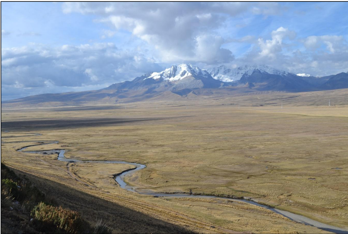
Vista del nevado Jeulla Rajo en la Pampa de Lampas – Conococha, puerta de ingreso al Callejón de Huaylas

Gran parte del espacio que hoy ocupa la provincia de Bolognesi, en la Región Ancash era conocida en la época colonial temprana bajo el nombre de la región de Lampas, que a su vez formó parte de la porción norteña del corregimiento de Cajatambo. Toda esta región en el Horizonte Tardío (1470) estuvo anexada política y administrativamente al Estado Imperial Inca, teniendo como eje integrador un ramal del camino longitudinal de la sierra, que nacía en el centro administrativo de Pumpu (Pasco) y que continuaba con rumbo noroeste hacia el Callejón de Huaylas (Ancash). La vialidad Inca de carácter formal no solo logró la articulación y control de las cabeceras de las cuencas del río Pativilca y Fortaleza, también anexo a un abigarrado conjunto de grupos étnicos de habla quechua, ubicados sobre las márgenes occidentales y orientales de la Cordillera Blanca y Negra.