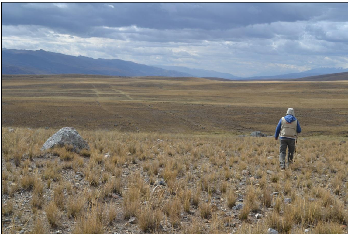
Camino de tipo despejado, formado con alineamientos de piedras, presenta un ancho promedio de 29 m.

El trayecto del Camino Inca continuaba por toda la Pampa de Lampas, en pleno piso ecológico de puna, en un trayecto de 50 km. de longitud, manteniendo un ancho promedio de 25 m., por encima de los 4000 msnm. En su avance cruza las nacientes del río Santa, llegando a la localidad de Pachacoto, puerta de ingreso al Callejón de Huaylas. El Qhapaq Ñan articulaba los principales establecimientos Incas de Yanamarca, Huariraga, Pachacoto y Pueblo Viejo.