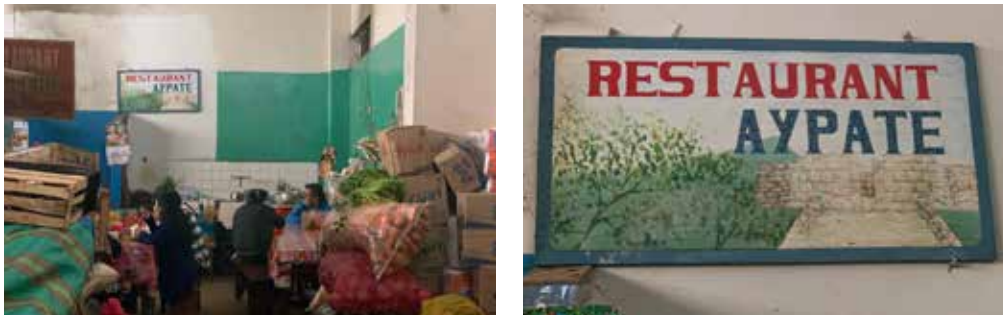
Foto N° 6. "Restaurante Aypate", se encuentra ubicado en el mercado municipal, nótese el pórtico reproducido en la pintura

Se ha realizado un registro de las imágenes que las personas han reproducido, la gran mayoría a nivel de pintura mural.