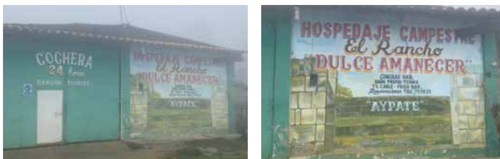
Foto N° 9. Reproducción del pórtico del Acllawasi en hospedaje ubicado en el Centro Poblado Ayabaca.

La reproducción de las imágenes de Aypate también obedece a relaciones comerciales, es decir, a la búsqueda de vincular la imagen del pórtico del Acllawasi con negocios relacionados al turismo, este claro ejemplo se puede apreciar en las fotos 9 y 10 (la primera reproduce Aypate para invitar al visitante a poder alojarse en un hospedaje y la segunda busca apropiarse solo del nombre a fin de que represente a su negocio).