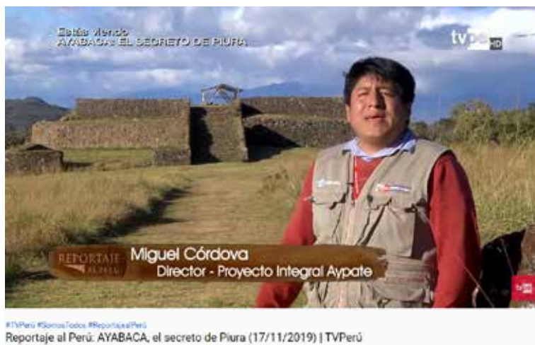
#TVPerú #SomosTodos #ReportajealPerú Reportaje al Perú: AYABACA, el secreto de Piura (17/11/2019) | TVPerú

En esa misma línea, la gestión actual del Proyecto Integral Aypate busca visibilizar en importantes medios de comunicación al sitio arqueológico, esto se ha logrado gracias a un trabajo conjunto con la Municipalidad Provincial de Ayabaca, así se logró poder realizar un reportaje en TV Perú -Canal 07 – en el programa “Reportaje al Perú” (17.11.2019) conducido por Manolo del Castillo y un reportaje en Latina Noticias (edición dominical del 18.12.2020)