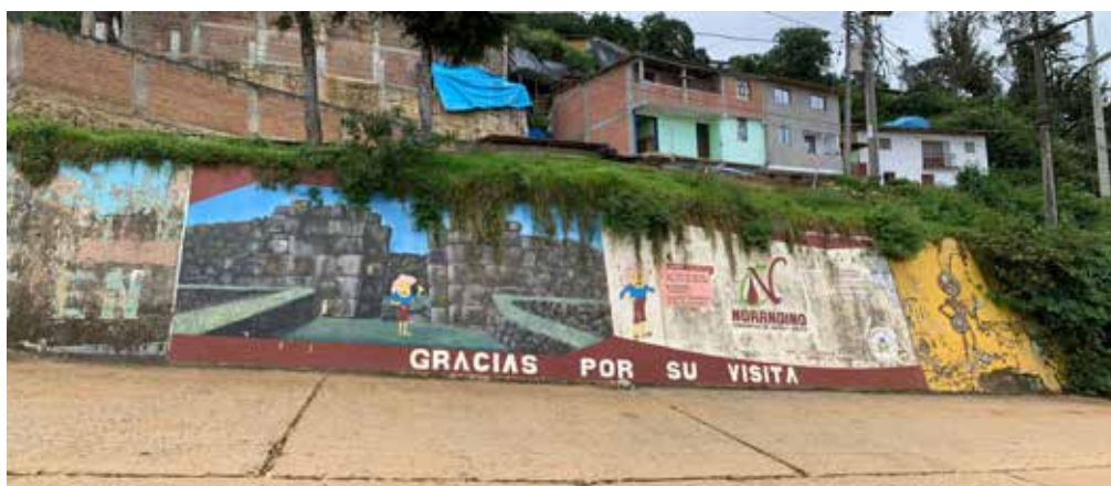
Foto N° 11. Representación mural de la institución financiera “Cooperativa de Ahorro y Crédito Norandino” ubicada en Av. Piura s/n número.

Imágenes de Aypate también han sido reproducidas por instituciones privadas tipo financieras, es así que la “Cooperativa de Ahorro y Crédito Norandino” presenta hacia la salida del Centro Poblado de Ayabaca el pórtico del Acllawasi de Aypate.