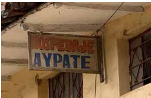
Foto N° 10 . Apropiación del nombre para representar en hospedaje ubicado en el Centro Poblado Ayabaca.