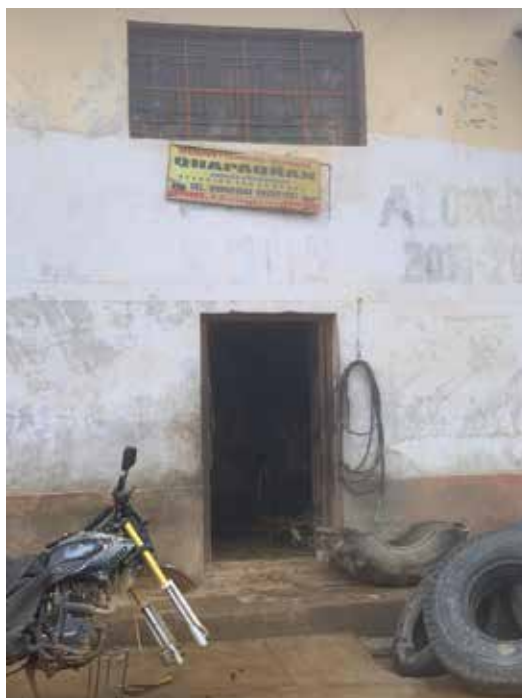
Foto N° 12. Representación en cartel publicitario de “Negocios y servicios generales QHAPAQ ÑAN” ubicada en Av. M. Francisco Rentería. Centro Poblado Ayabaca.

Es rescatable que no solo la imagen del pórtico del Acllawasi haya sido reproducida por diferentes personas e instituciones, también se ha experimentado una apropiación del nombre “Qhapaq Ñan”, proyecto nacional dentro del cual el Proyecto Integral Aypate desarrolla sus actividades.