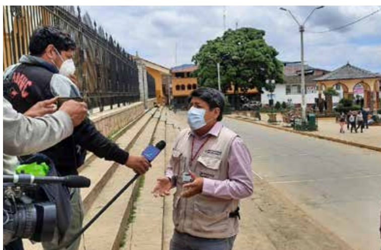
Foto N° 2. Latina Noticias edición dominical transmitido por Latina (Canal 02) el 18.12.2020