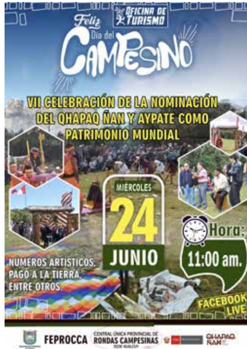
Foto N° 3. Flyer preparado por la Municipalidad Provincial Ayabaca con motivo de nuestra transmisión del evento del 24.06.2020

Se vienen realizando transmisiones en la radio local (Radio la Voz del Campesino 1520 AM) con la finalidad de seguir reforzando la presencia e importancia de Aypate, en una zona con alto nivel rural como Ayabaca, la radio es un poderoso medio de comunicación.