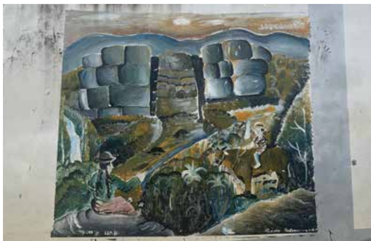
Foto N° 8. Representación del pórtico del Acllawasi de Aypate. Mural ubicado en calle Bolognesi s/n Centro Poblado de Ayabaca. Nótese la relación con la vida rural representada por pobladores a caballo.

La reproducción de las imágenes de Aypate también obedece a relaciones comerciales, es decir, a la búsqueda de vincular la imagen del pórtico del Acllawasi con negocios relacionados al turismo, este claro ejemplo se puede apreciar en las fotos 9 y 10 (la primera reproduce Aypate para invitar al visitante a poder alojarse en un hospedaje y la segunda busca apropiarse solo del nombre a fin de que represente a su negocio).