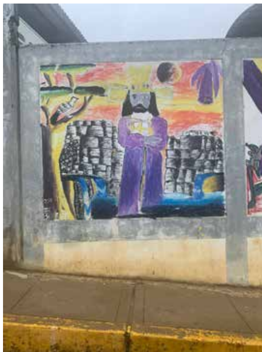
Foto N° 7. Representación del Señor Cautivo de Ayabaca con el fondo del pórtico del Acllawasi de Aypate. Mural ubicado en calle Bolognesi s/n Centro Poblado de Ayabaca

Es importante indicar que la religiosidad que caracteriza a la población de Ayabaca, evidenciada en su fervor y dedicación al Señor Cautivo, se relaciona con el pórtico del Acllawasi (foto 7), esto como una clara forma de sentirse representados por dos fuertes imágenes y significados que se considerarían los más prestigiosos.