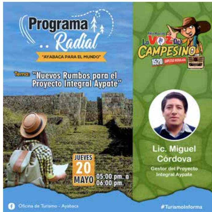
Foto N° 4. Programa radial transmitido el 20.05.2021.